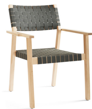
ALVA STRA 160