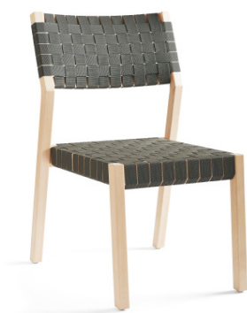
ALVA STRA 061